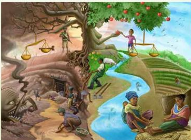
Du carré minier au carré potager