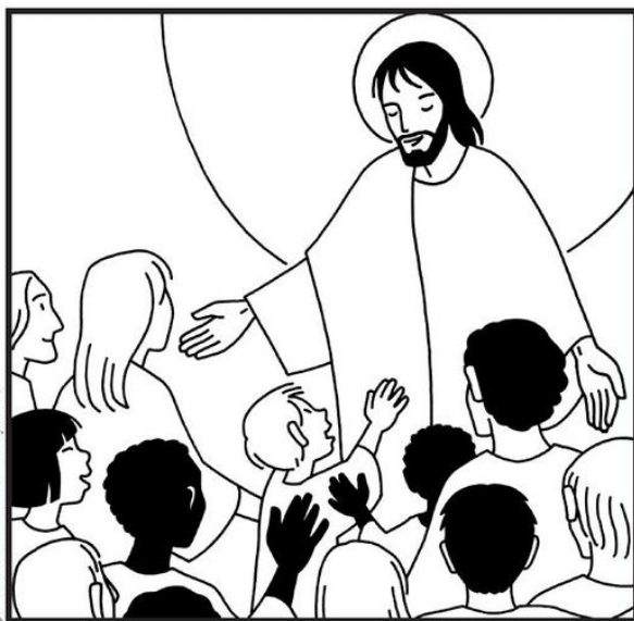
J.-F. Kieffer © Mame-Tardy 2013

10 ème dimanche ordinaire, Le Saint sacrement Eucharistie célébrée pour tous les membres de notre communauté.