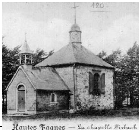
Hautes Tignes — La chapelle Fischbach

CEPENDANT il y aura Eucharistie annulée également ! une eucharistie à 11h, le 29/08 en respectant les distanciations sociales !