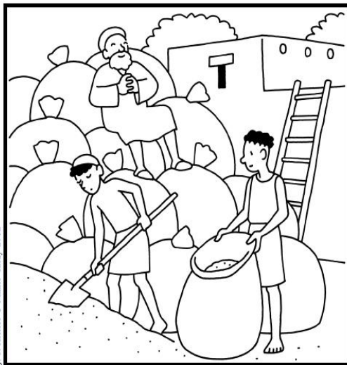
J.-F. Kieffer © Mame-Tadé 2012

Seigneur Jésus, voici toutes mes richesses. C'est pour toi, car je veux vivre avec toi pour toujours. Amen.