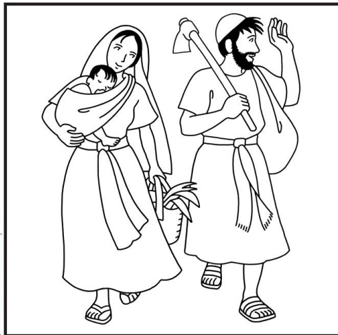
J.-F. Kieffer